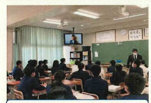
テレビ放送での退任のあいさつ

11月26日(木)生徒会役員認証式ならびに退任式がありました。新型コロナウイルス感染症拡大防止に伴い、第41期生徒会の皆さんは、これまで考えたことのない大きな壁に何度も何度も苛まれました。しかし、「平野中学校の進化を止めない」「今だからできることをやり続ける」という志のもと、本当によくがんばりました。その志はしっかりと、そして確実に第42期生徒会に引き継がれていくはずで。第41期生徒会の皆さんの頑張りに、平野中学校のすべての人から拍手を送ります。ありがとうございました。