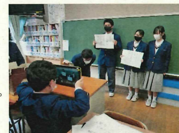
写真 動画コンクールの様子

中学校は、学校行事を通して、望ましい人間関係を形成したり、他者と協働する中でよりよい学校生活を築こうとする自主的・実践的な態度を育てたりします。本年度は、体育祭や合唱コンクール、自然教室、修学旅行など多くの学校行事が中止となりました。そこで、その機会が少なくなった1・2年生では日常の取組の中で生徒たちを成長させるために2学期から様々な取組をしています。