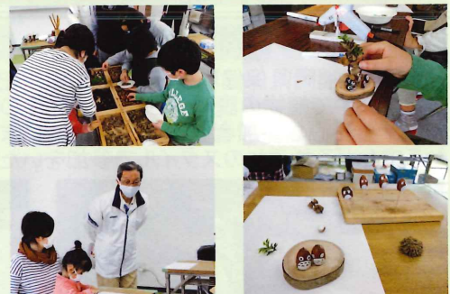
イベント開始時には、井本大野城市長も駆けつけていただきました。