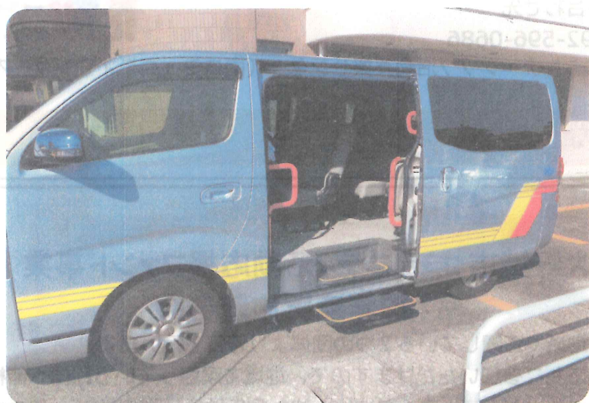
ステップと手すりを備えています