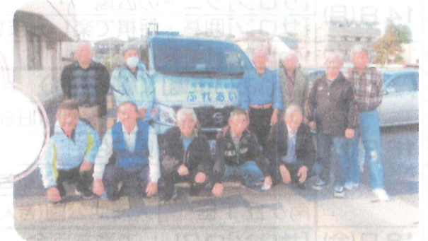
ボランティア運転手の皆さん