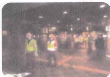
夜間パトロール (昨年12月)

昨年度から子ども・青少年育成部部長を拝命しております。昨年初からの新型コロナウイルス感染拡大の影響による緊急事態宣言のため、南コミユニティにおける諸行事を行うことができませんでした。また、小中学校におかれましては多くの行事を中止・縮小せざるを得ないことになり、保護者の皆様におかれましてはストレスが溜まったのではないのでしょうか。 青少年の健全育成のため、育成部としては昨年同様、関係団体・小中学校教職員・保護者の方々とコミュニケーションを深め、情報交換・共同作業を通じて交流の機会を作っていききたいと思っておりますので、ご支援とご協力をお願いいたします。