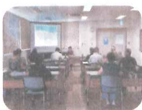
広報誌研修 (今年7月5日)

今年度もコロナ禍の影響のため、情報広報部の活動もかなり制限されること予想されます。それでも、4月5日の初回会議で部員の総意として「コロナ禍の中でも、昨年度に引き続き南コミ事務局と連携しながらできる限り南コミの行事や各部の活動、地域の情報などを掲載していく」という方針を確認しました。た