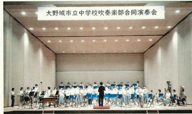
大野城市立中学校吹奏楽部合同演奏会

先輩たちの頑張りを受け継ぎ、「さあ、これから頑張ろう!」という気持ちになって新チーム・新体制での活動を開始しようとした矢先に、8月31日まで部活動全面中止という報告を聞いた生徒の皆さんの気持ちを思うと、かける言葉がありませんでした。夏休み期間中に部活動が全面中止になったのは34年間の教員生活で初めての事です。緊急事態宣言が9月12日(日)まで出ているので、この状況はまだ続きます。