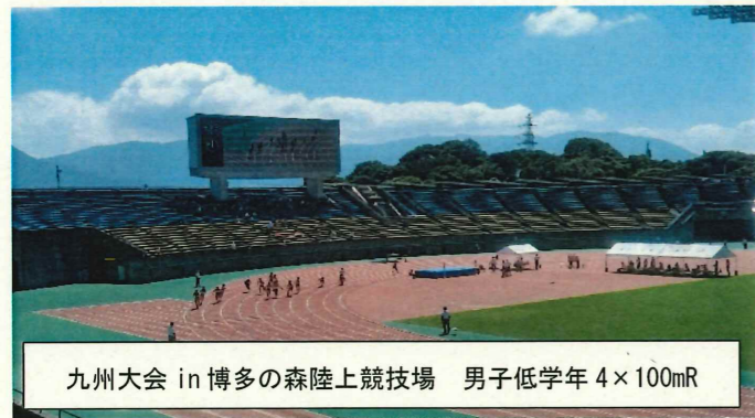
九州大会 in 博多の森陸上競技場 男子低学年4×100mR

感染対策のため無観客で開催された大会が多くありましたが、陸上競技の九州大会、福岡サンパレスで開催された吹奏楽コンクール、まどかぴあで開催された大野城和太鼓フェスティバル、大野城市立中学校吹奏楽部合同演奏会などには会場へ行き、生徒の皆さんが一生懸命に走る姿や演奏する姿を参観することができました。