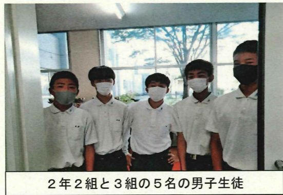
2年2組と3組の5名の男子生徒

校長室前を通る時に、ドアの前で立ち止まって、必ず校長先生の顔を見てあいさつをする男子生徒がいました。最初はその男子生徒だけでしたが、そのうち一緒にいる友人たちも同じ行動をとってくれるようになりました。このあいさつをきっかけに、校長先生は男子生徒たちの顔と名前を覚えて、「写真をとって学校だよりで紹介してもいいかな？」と声をかけることになりました。これも立ち止まりあいさつが繋ぐ出会いの一つです。