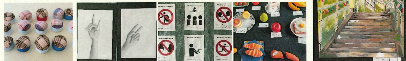
1年ピンクッション(家庭) 1年手の素描(美術) 2年ピクトグラム(美術) 2年塑造(美術) 美術部個人制作

10月27日(水)に校内文化発表会を行いました。残念ながら、感染症対策をとりながら学年ごとの分散開催になりました。クラス合唱は実施できず、また、緊急事態宣言解除から間がないことから、ステージ上で吹奏楽部や光輝太鼓部が生演奏を披露することはできませんでしたが、事前に録画した映像を学年ごとに体育館で鑑賞しました(被災地派遣研修の発表、3年有志のダンス披露の映像もありました)。一方、展示の部では、書道、美術、家庭科の授業や宿題で制作した作品、美術部、自然科学部、カラーガードの部活動で制作した作品が展示され、一人一人のアイデアと感性溢れる作品ばかりでした。生徒は、学級ごとに設けられた展示見学の時間に友だちや先輩の作品を見て回り、あちらこちらで「認め合い」の声が聞かれました。