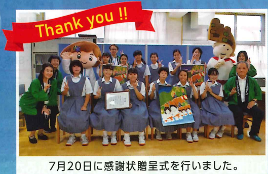
7月20日に感謝状贈呈式を行いました。

デザイン画制作・協力：大利中学校 美術部 毎年受け継がれてきた旗の舞。旗を持ち、前方を見つめ居並ぶ中学生の姿に、市制50周年の伝統を受け継ぎ、さらに未来へとつないでいく決意を表しました。