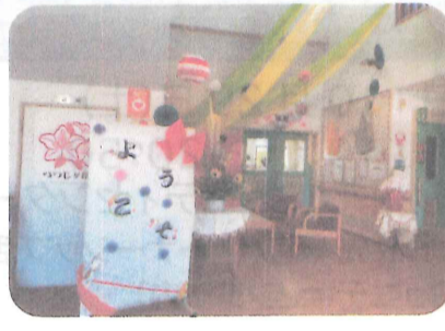
つつじヶ丘公民館