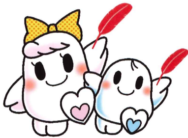
赤い羽根共同募金運動のシンボルキャラクター あいちゃん(左)と のぞくん(右)

赤い羽根共同募金運動は、戦後間もない昭和22年から全国一斉に始まり、令和4年に76回目を迎えます。