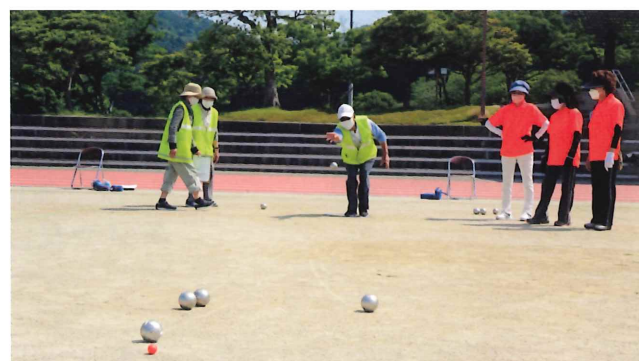
シニアクラブパタンク大会