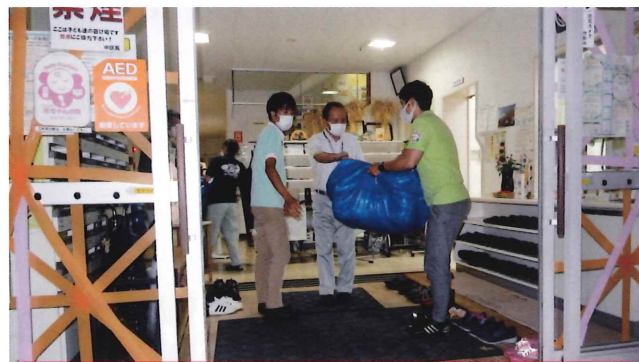
避難所への寝具貸出の支援