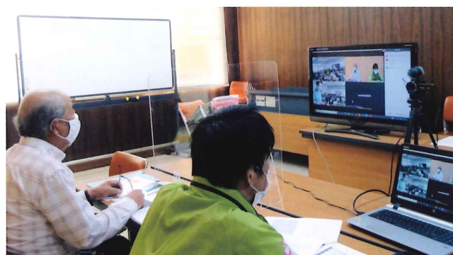
オンラインで福祉についての授業