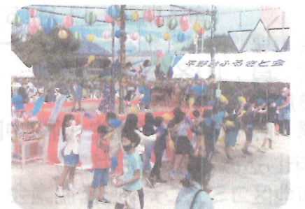
きてんしやい秋祭り