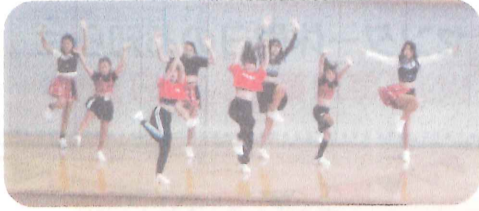
広場の盛り上がり