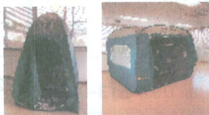
プライバシーに配慮した 避難施設

災害が発生したときなどに被害を最小限に抑えるため、生命・身体を守る適切な避難行動がとれるよう、市内全ての公民館・コミュニティセンター・小中学校などで、同日・同じ時間に一斉におこなう大野城市民総ぐるみ防災訓練が、11月26日に行われました。 14時5分、災害情報伝達システム(屋外スピーカー)を用いた訓練の緊急地震速報の放送から開始されました。 南コミュニティセンターでは、仮設トイレの設置、受付準備、福祉避難所を意識した避難所設営として、「一般避難者」「知的・発達障害者・椅子使用者」「要介護者」「視覚・聴覚障害者」「知的・発達障害者・精神疾患患者・パニック障害対応」「妊産婦・乳幼児」の状態に合わせた部屋割り、プライバシーに配慮した避難施設設営などの防災訓練が実施されました。