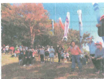
11/3 平野台区 第2回絶叫大会