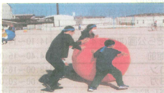
10/30 月の浦区 ミニ運動会