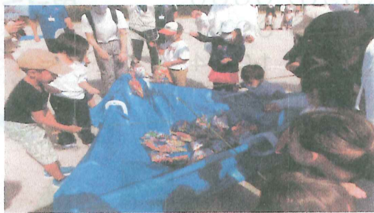
10/16 つつじヶ丘区 レクリエーション大会 お菓子釣り