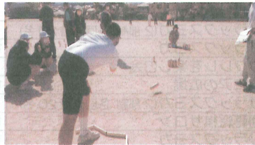
10/23 南ヶ丘1区 スポーツフェス モルック(フィンランド発祥)