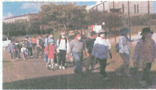
10/23 南ヶ丘2区 子どもと歩こう会