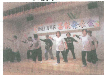
11/13 若草区 芸能発表会

10月30日 平野小学校の体育館で、シニアクラブ16チームによる「五目お手玉大会」が開催されました。 各コート別に、平野台区平寿会A、若草区A、平野台区平寿会B、南ヶ丘1区Bチームが優勝しました。