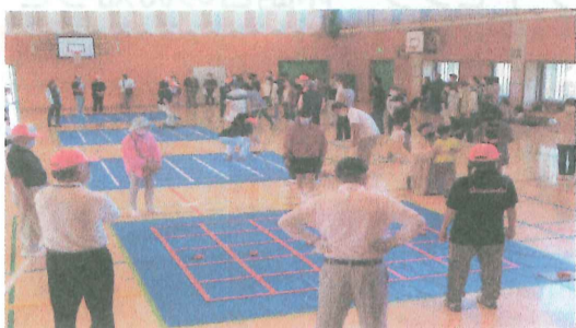
10/16 平野台区 組親善スポーツ大会 五目お手玉