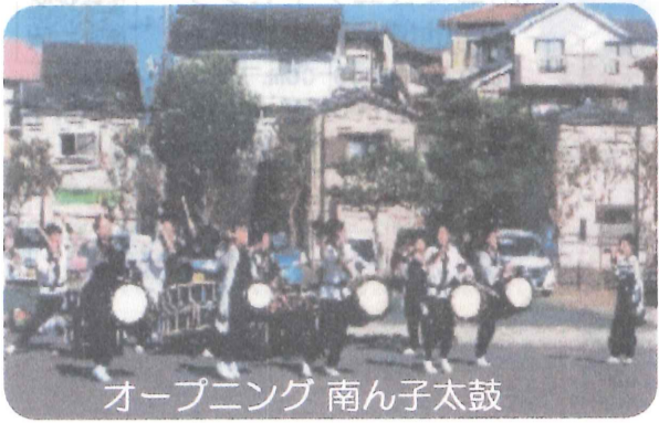
オープニング 南ん子太鼓

11月5日(日)さわやかな秋空のもと、南コミュニティでまつり南風が開催されました。作品等の展示や竹馬体験・竹炭配布、折り紙コーナーや車椅子体験、カレンダー撮影や健康食試食、パンやカレーなど飲食の出店がありました。また、多目的ホールでは子どもたちが型抜きを真剣に取り組みました。各ブースをまわるスタンプリーパーではおみやげをもらい、久しぶりのまつりは多くの人出で賑わいました。