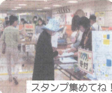
スタンプ集めてね!