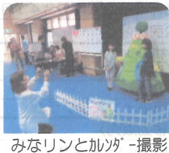
みなリンと加ッパ-撮影