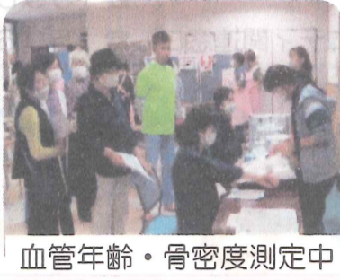
血管年齢・骨密度測定中