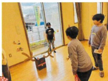
楽しいミニゲーム!

公民館はかわいいクリスマスのバルーンで飾られ、ほっこり温かいイベントとなりました。