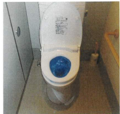
災害発生後、自宅のトイレが使えなくなったら・・・