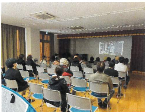
甚大な地震被害と防災対策についてのDVD上映をしました