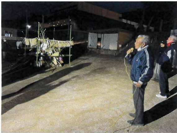
～良い1年になりますように～