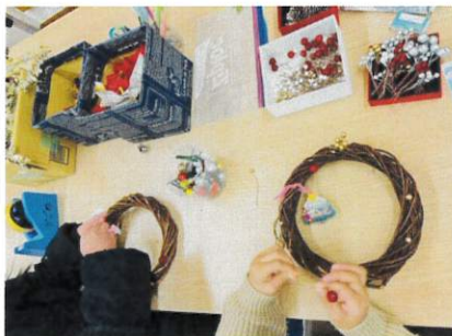
いろんなパーツでリース作り