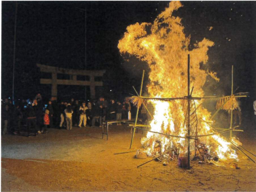
～龍神様のご降臨により、ご加護がありますように～