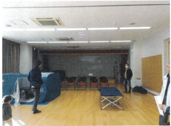
公民館に備蓄している簡易ベッド、ファミリーパーテーションなどを実際に区民の皆さまに設置してもらいました