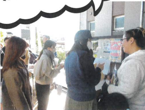
一時避難所から公民館へ集合しているところです