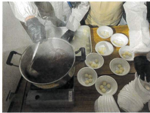
～ぜんざいもふるまわれました～