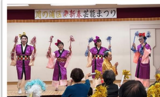
月の浦にもマツケンサンバが...

中学生の光輝太鼓に始まり、最後のプログラムまで大いに盛り上がり、皆様のおかげで楽しく芸能まつりを終える事ができました。 ご協力いただいた皆様、ありがとうございました。 文化部長