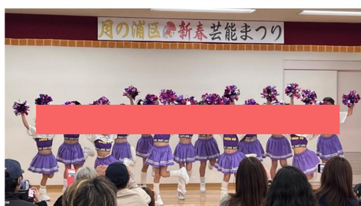
元気いっぱい キッズダンス