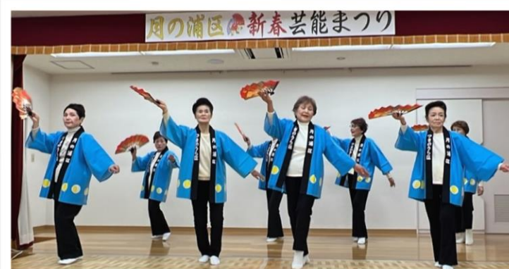
新春を慶ぶ “祝いめでた”