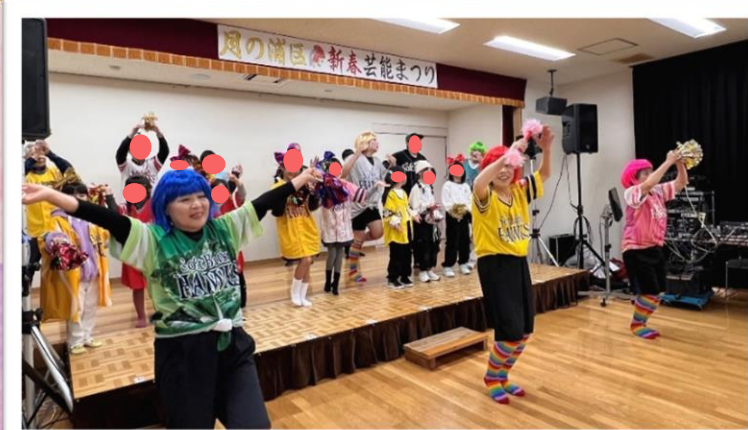
最後は会場一体となって “いざゆけ若鷹軍団”