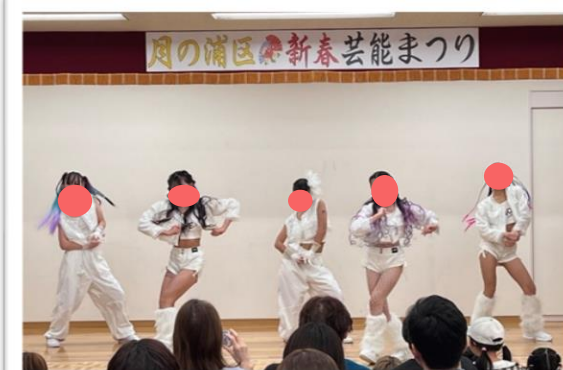
カッコいいダンスでキメッ!