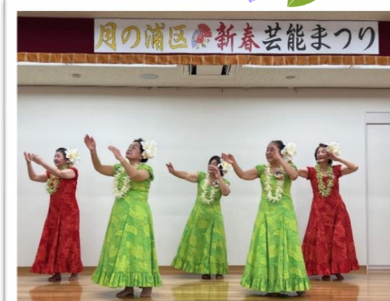
華やかなフラダンス