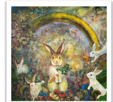
月の浦小学校へ寄贈